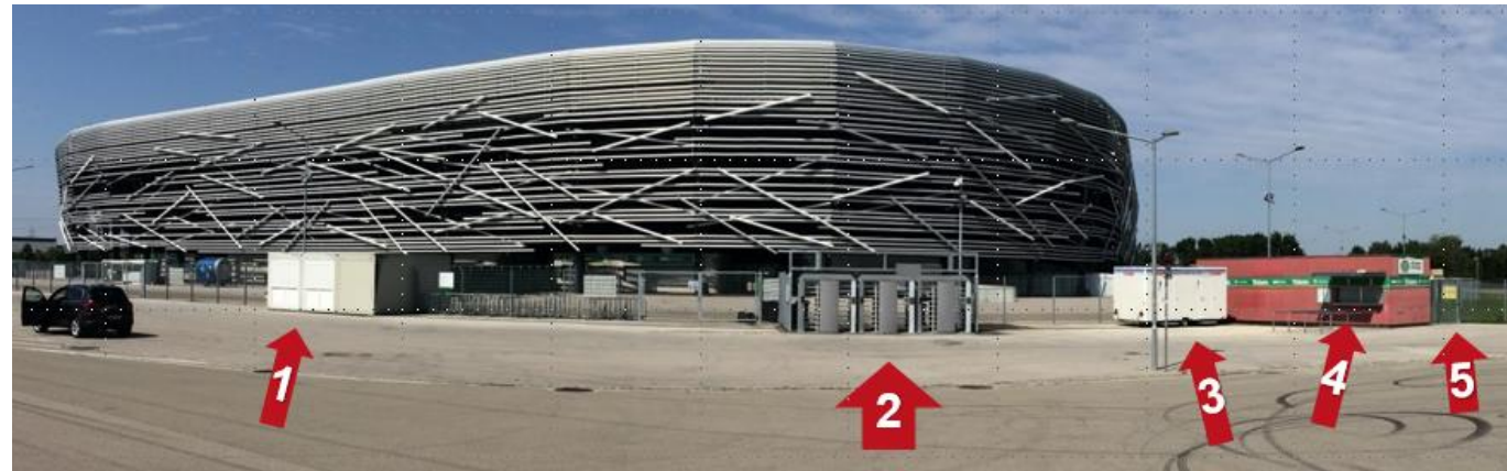
1 = Abgabestelle; 2 = Stadioneingang; 3 = WC vor dem Stadion; 4 = Gästekasse / Ticket-Clearing; 5 = Zugang Materialkontrolle

Die Materialschleuse für die Kontrolle der Fanutensilien ist von außen einsehbar. Selbstverständlich kann die Materialkontrolle von Euren Fanbeauftragten, Eurem Fanprojekt und Eurer / Eurem Sicherheitsbeauftragten begleitet werden. Nach erfolgter Materialkontrolle werden Eure Eintrittskarten gescannt und der Bodycheck durchgeführt. Anschließend könnt Ihr durch die Schleuße mit dem Material ins Stadion gehen.